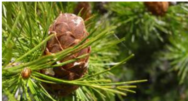
“Bovate” de mélèze | Terme savoyard pour désigner un cône

Les conditions difficiles de son habitat permettent au mélèze d'acquérir des qualités mécaniques et de longévité reconnues de longue date.